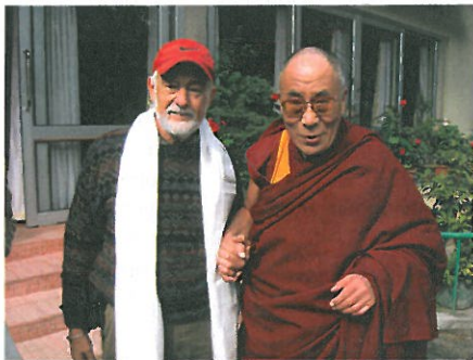
Visita con su Santidad el Dalai Lama en su residencia en Dharamsala, la India