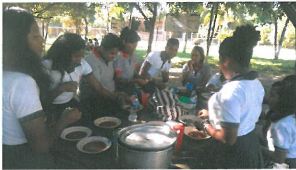
Programa Nutricion Estudiantil Cabao